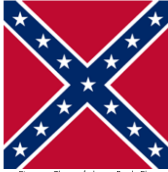
Figure 1 - The confederate Battle Flag