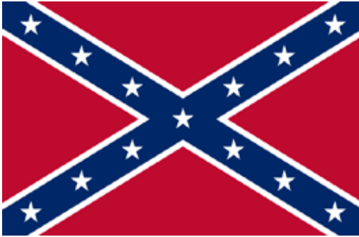
Figure 5 - The Confederate flag today