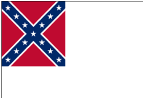
Figure 3 - The Stainless Banner