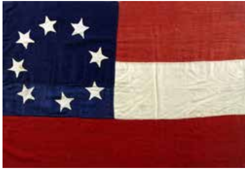
Figure 2 - The Stars and Bars